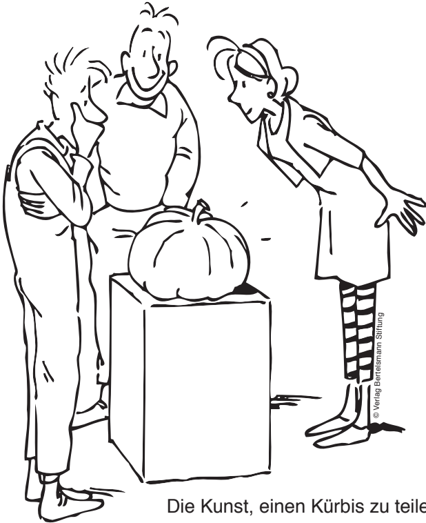
Die Kunst, einen Kürbis zu teilen.

Wer sich dafür entscheidet, sollte die gesamte Zeit dabei sein.