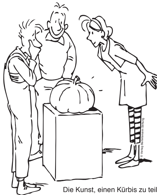
Die Kunst, einen Kürbis zu teilen.

Das Konzept kann in unterschiedlichen Kontexten eingesetzt werden: Überall dort, wo Menschen miteinander agieren. Inzwischen findet es Anwendung vom Bereich der frühkindlichen Bildung an über den schulischen und außerschulischen Bereich bis zur Erwachsenenbildung.